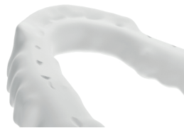
Guide canin et antérieur