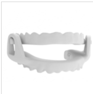
Limitación de apertura

LAS SIGUIENTES CARACTERÍSTICAS PODRÁN SER CONFIGURADAS POR EL ODONTÓLOGO.