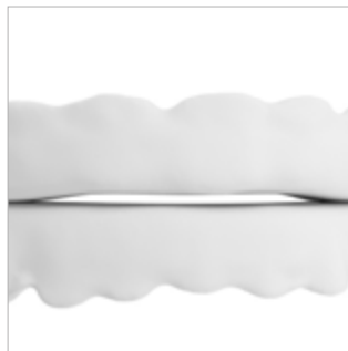
Apertura anterior frontal