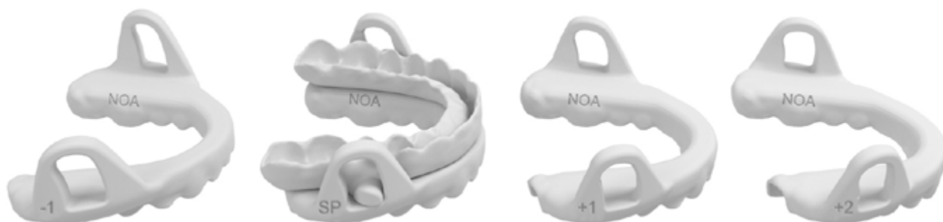
Férula inferior -1